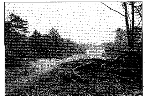
Blick zum Europark Dreilinden